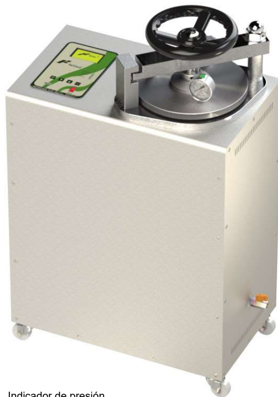
Indicador de presión y temperatura de ciclo